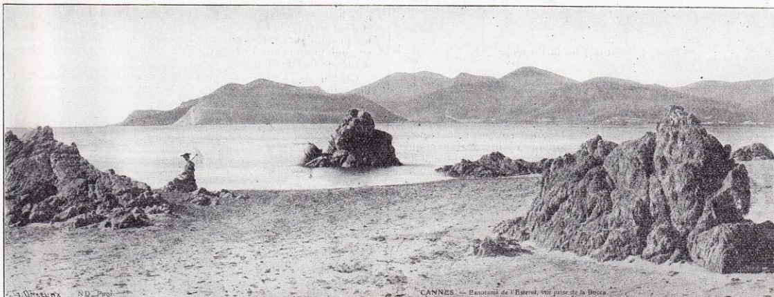
Cannes. — Panorama de l'Esterel, vue prise de la Bocca.

L'Esterel, dont le nom seul est évocateur pour nous de tant de grâce sauvage, de tant de beauté agreste, est ce puissant massif rocheux qui se dresse sur le littoral de Provence comme un bastion avancé des Alpes-Maritimes, entre Cannes et Fréjus. Nulle